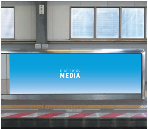
ホームスクリーン ミニタイプ