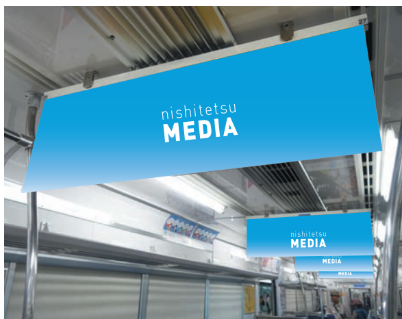
「中吊り広告」5竿の片面すべてに掲出する媒体です。